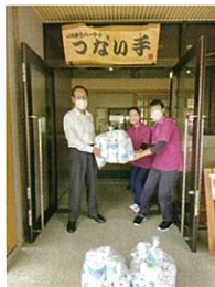
(JAゆうハートつない手)